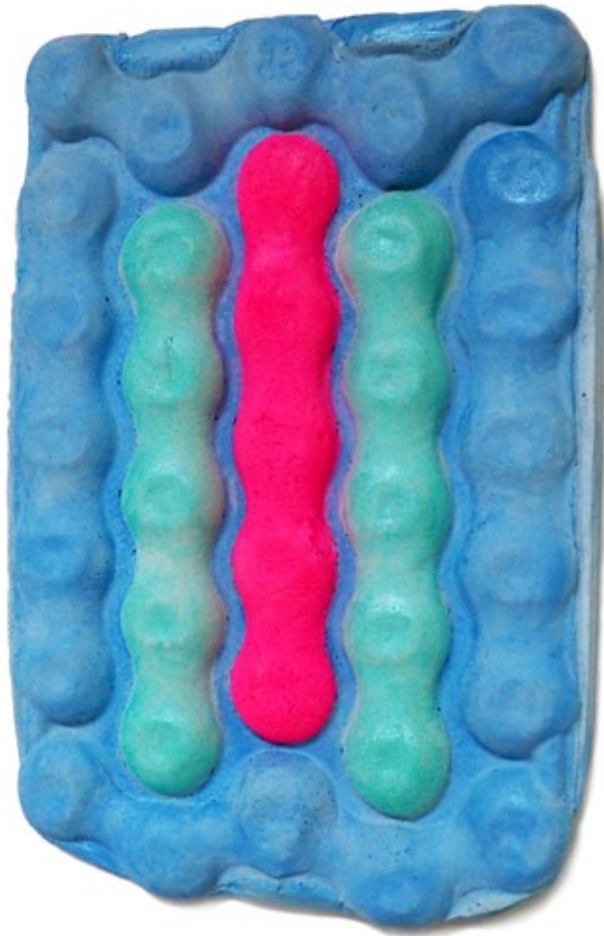
Umverpackung 48 Beton, Pigment 57x38,5x4 cm, 2018