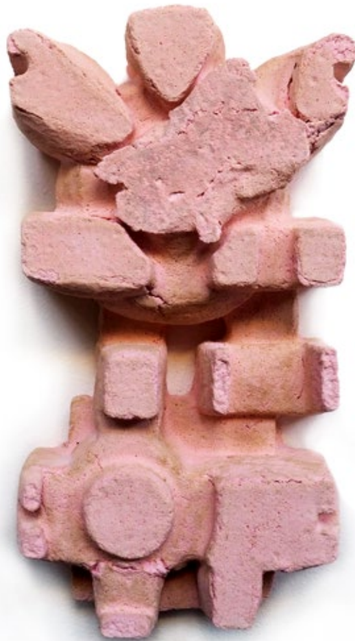
Umverpackung 34 Beton, Farbe 31,5x17x7,5 cm, 2018