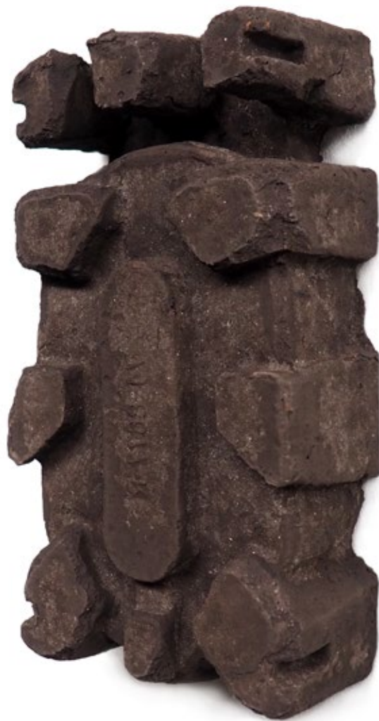
Umverpackung 12 Ton, Schrühbrand 27x12x7 cm, 2018