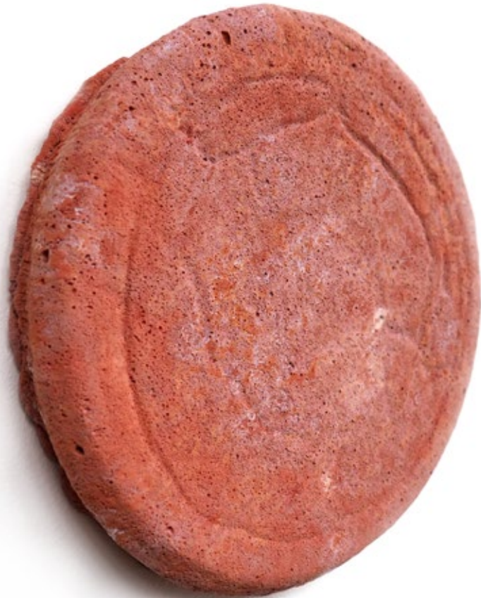
Umverpackung 25 Beton, Farbe, Pigment 18x18x3,5 cm, 2018