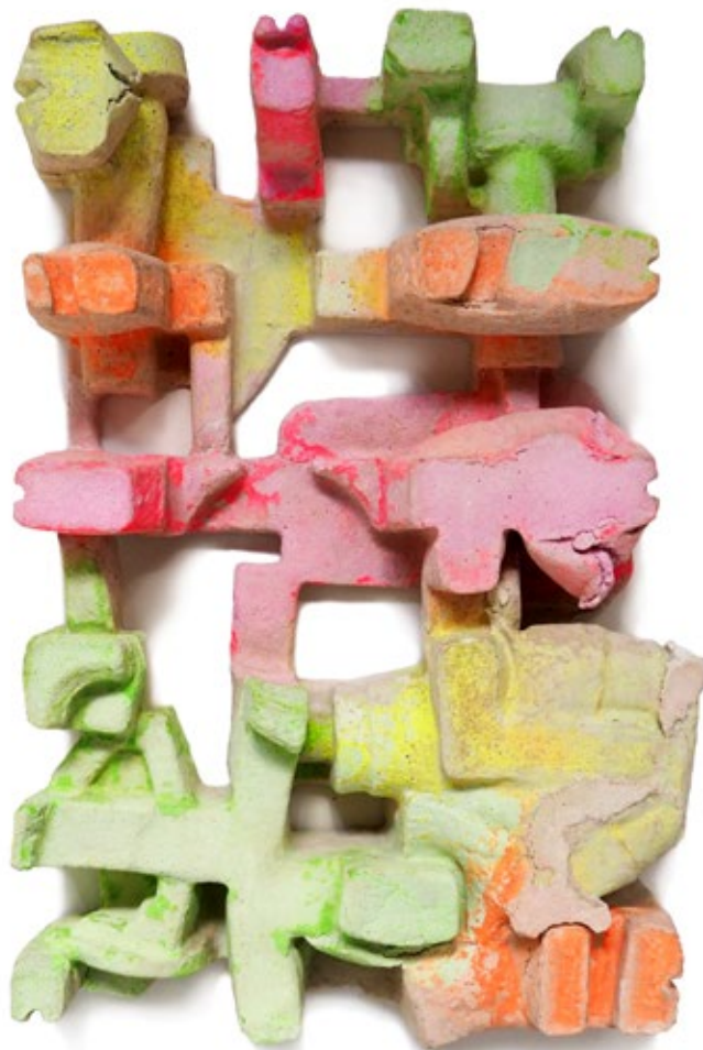
Umverpackung 61 Beton, Farbe 54,5x33,5x10 cm, 2019