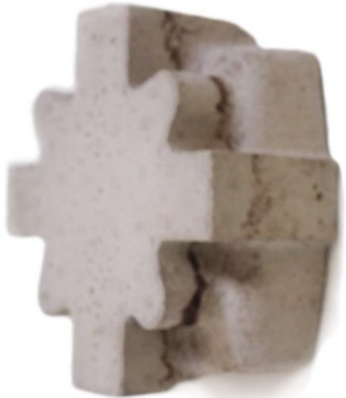
Umverpackung 1 Beton, Farbe je 19x19x7 cm, 2017