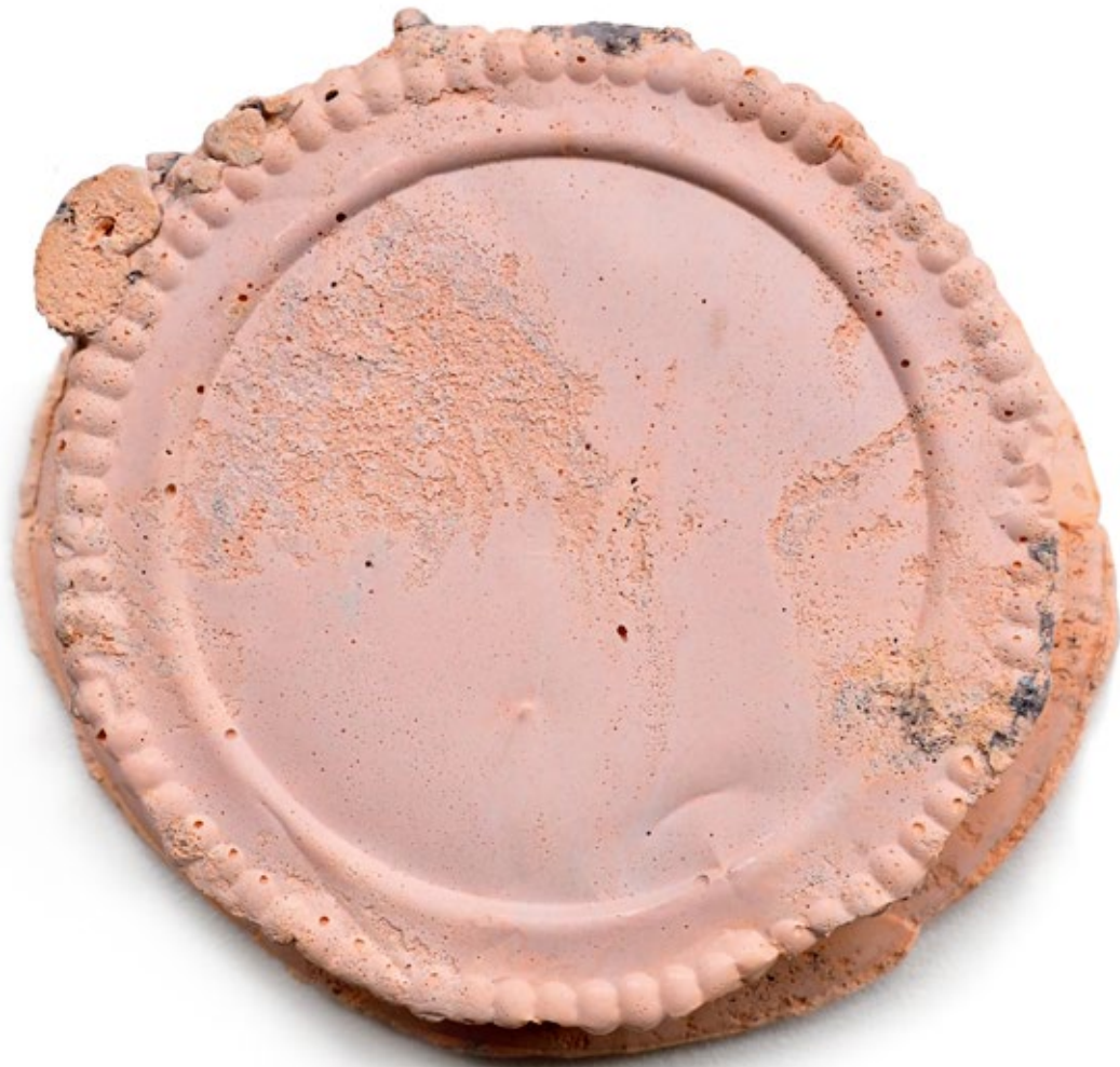
Umverpackung 27 Beton, Farbe 18x18x4,5 cm, 2018