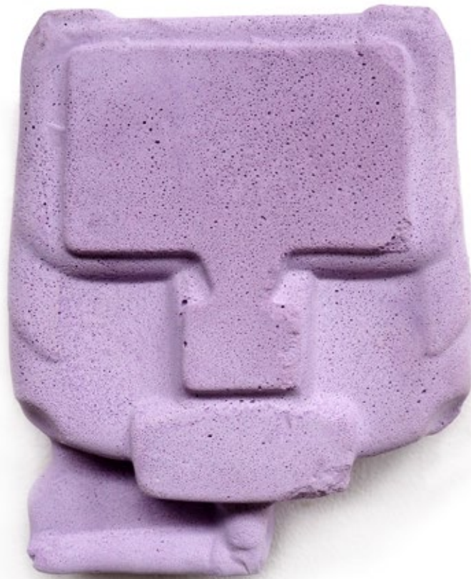
Umverpackung 20 Beton, Farbe, Pigment 16,5x13,5x6 cm, 2018