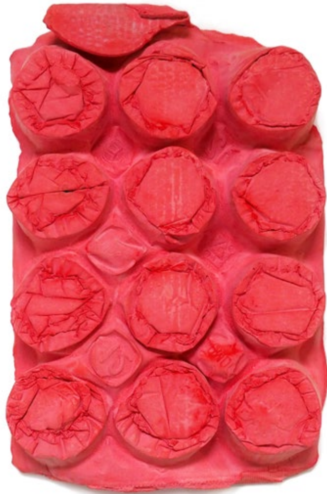
Umverpackung 45 Beton, Pigment 40x26x4,5 cm, 2018