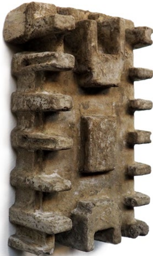
Umverpackung 32 Beton 24,5x13,5x7,5 cm, 2018