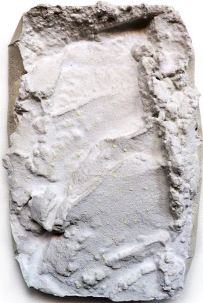
Umverpackung 15 Beton, Farbe 26x18x6 cm, 2018