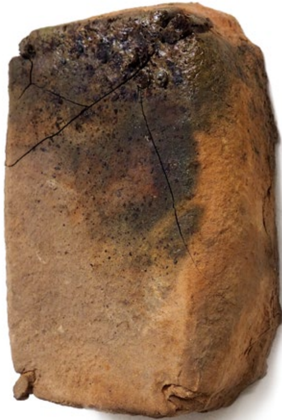
Umverpackung 31 Ton, Holzbrand 17,5x 11,5x5,5 cm, 2018