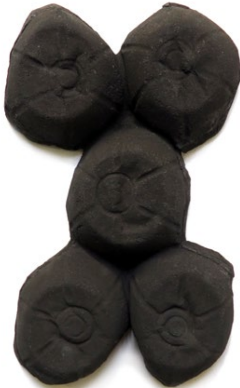
Umverpackung 46 Beton, Pigment 39,5x23,5x5 cm, 2018