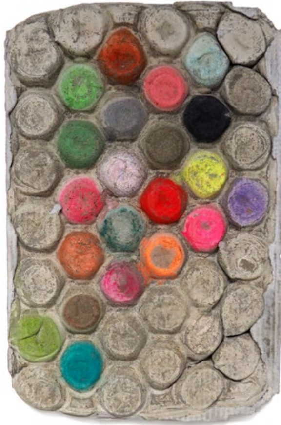
Umverpackung 64 Beton, Pigment, Farbe 58,5x38x4 cm, 2019