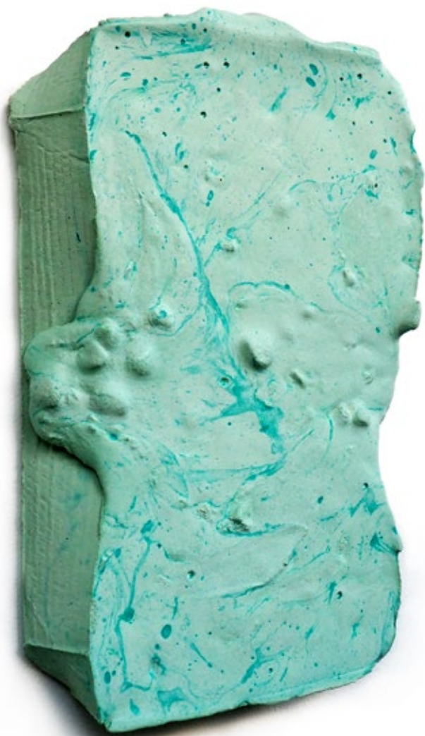
Umverpackung 35 Beton, Pigment 27,5x18x4 cm, 2018