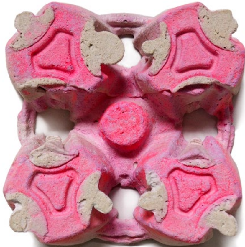
Umverpackung 60 Beton, Farbe 19x19x4,5 cm, 2019