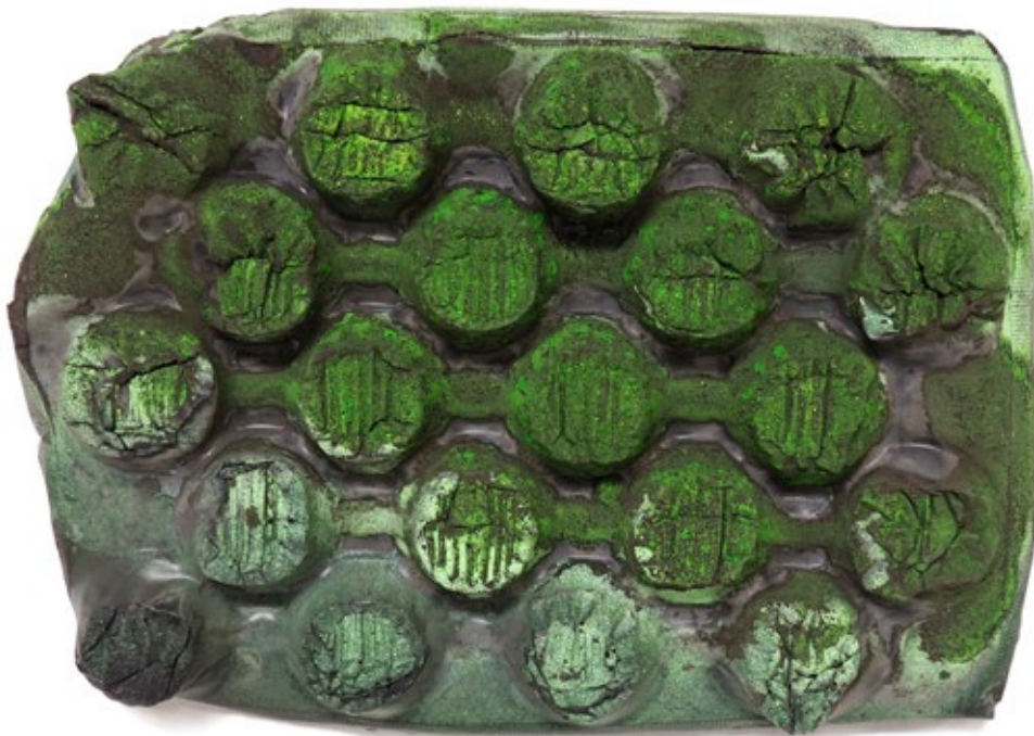
Umverpackung 55 Beton, Farbe, Glitzer 28,5x39,5x4,5 cm, 2018