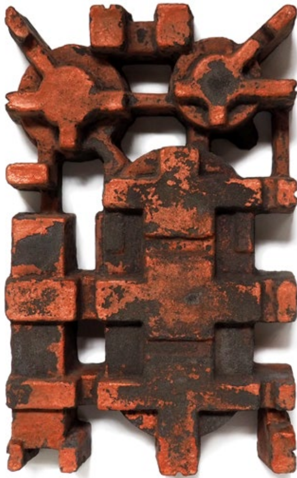
Umverpackung 57 Beton, Pigment 54x34x8 cm, 2019